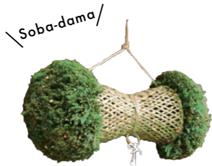
秋の新そばの入荷を知らせる「そば玉」。鼓形の竹細工です。

日本三大そばの一つ「戸隠そば」は、1人前を5、6束にして盛り付ける「ぼっち盛り」が特徴です。清流で、きりと締まったそばは、戸隠竹細工のざるに盛られて供されます。職人が生み出す「戸隠そば」と「戸隠竹細工」。受け継がれし伝統の逸品が、戸隠の文化を表しています。