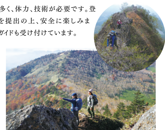
飯縄山登山は初級者でも楽しめる。360度パノラマビュー。