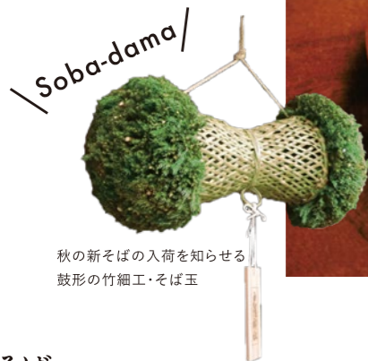
秋の新そばの入荷を知らせる 鼓形の竹細工・そば玉